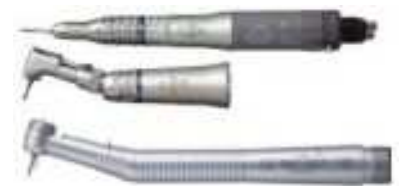
Pièce à main- Contre angle- Turbine