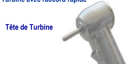
Tête de Turbine